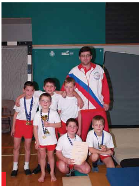
DP Akrobatika ekipno prvi 2007-2008