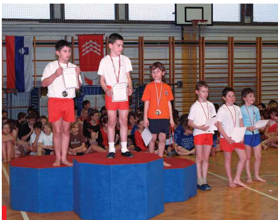
MPP Renče posamezno prvi 2008