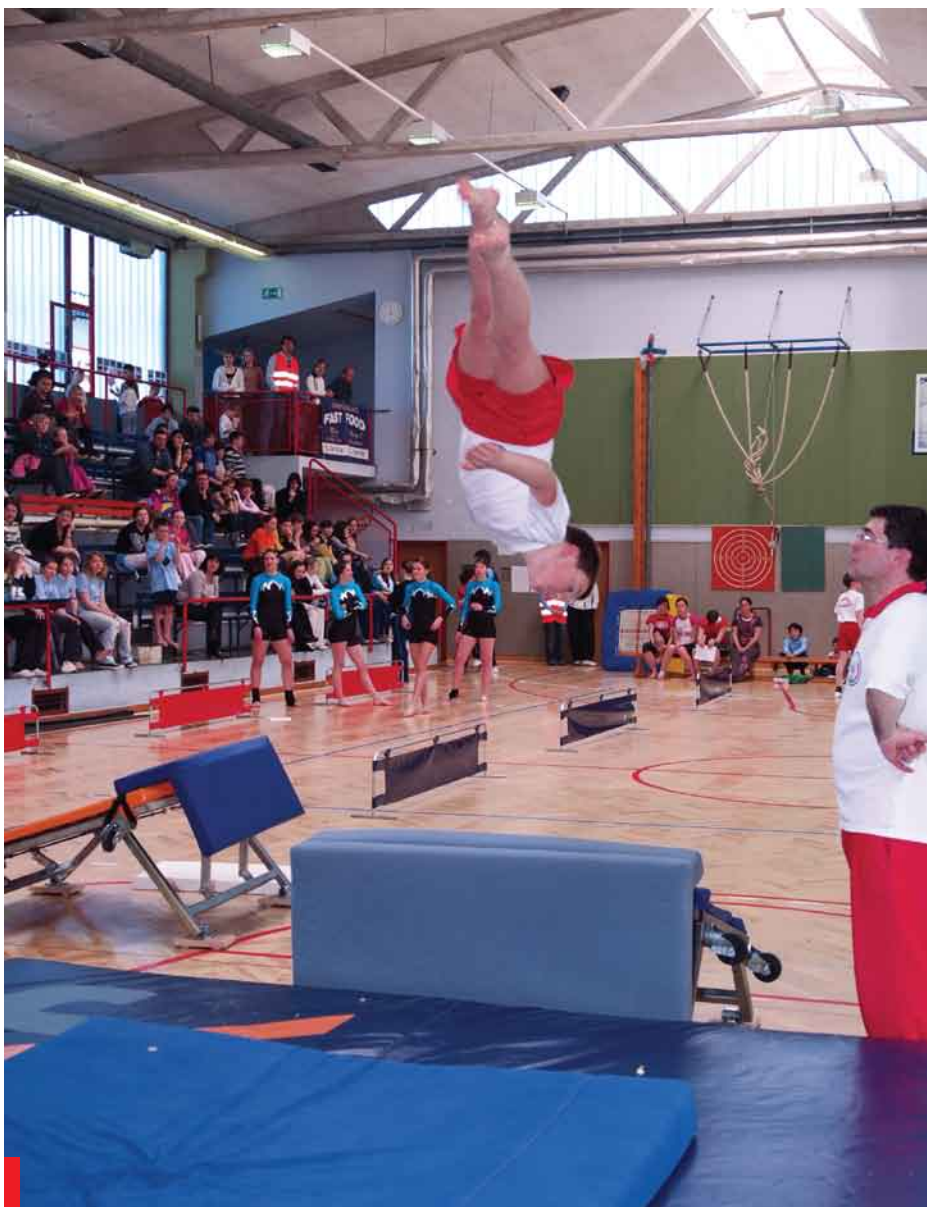
DPP Kopre Jan 2008

Izboljšani pogoji, ki jih je omogočila naša nova občina, so se odrazili tudi v dejavnosti našega društva.