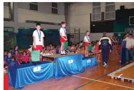
DP Sečovelje posamezno prvi 2007-2008

Dekleta so se dobro odrezala tudi na mednarodnem tekmovanju v športni gimnastiki v Košicah (Slovaška), kjer so med predstavnicami iz 12 držav osvojile ekipno 4. mesto. Vsekakor je to za našo žensko gimnastiko do sedaj največji uspeh. Pokazale so, da se lahko kosajo tudi z vrstnicami iz drugih držav. Prav na področju športne gimnastike želi-