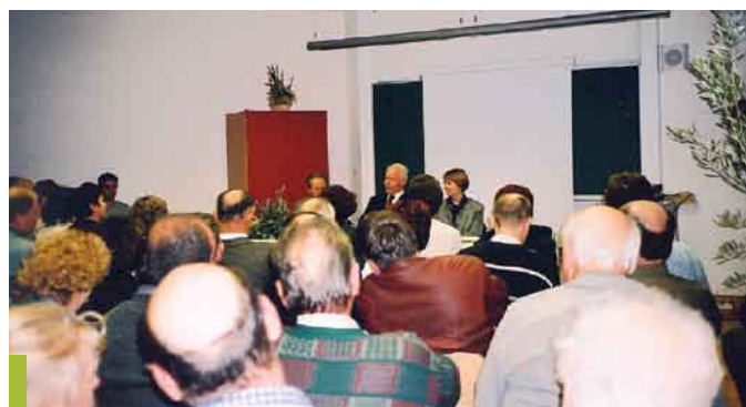
Zbor Goriškega oljkarškega društva

Oljkarstvo je začelo izgubljati pomen na Goriškem že v 19. stoletju, zaradi konkurence drugih maščob in virov za osvetljevanje, še posebej pa so razredčili število oljk prva svetovna vojna in priključitev naših ozemelj k Italiji, ki je imela olja v drugih predelih na pretek. Zadnji udarec je gojenju oljk zadala huda zima leta 1929, ko se je temperatura