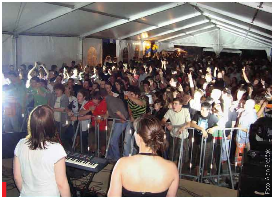
Runk fest 1

Prvi letošnji poletni vikend smo na Vogrskem priredili že tradicionalni vaški praznik. Z soncem obsijano tridnevno praznovanje je privabilo na Vogrsko veliko številko obiskovalcev.