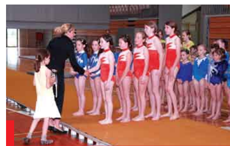
ŽŠG nivojsko Koper 2008

mo kvaliteto dvigniti na višji nivo. Za tak kvalitetnejši preskok pa razmišljamo o ustreznem, z gimnastičnimi orodji in pripomočki opremljenem prostoru. Šolska telovadnica, ki nam nudi gostoljubnost, je že za obstoječi program polno zasedena.