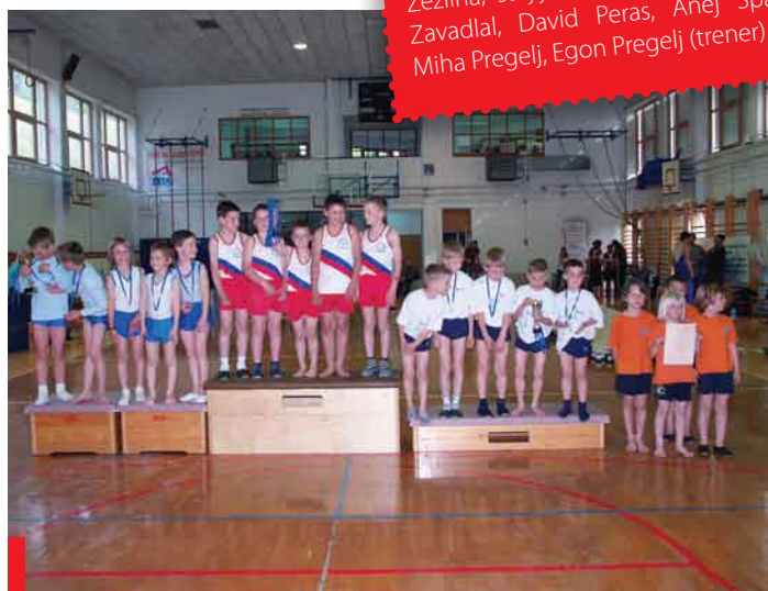
ŠG ciciban ekipno prvi 2007-2008

▶ redno vadbo. Moramo priznati, da nas je število presenetilo. Imeli smo vrsto STV in vrsto fizioterapije. Nekaj pa je bilo takih, ki so se vključevali v naše dejavnosti le občasno.