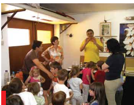
Pazljivo poslušajo razlago