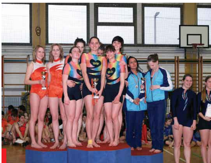
MPP članice ekipno druge 2008