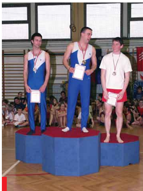
MPP Renče člani posamezno tretji Mugerli 2008