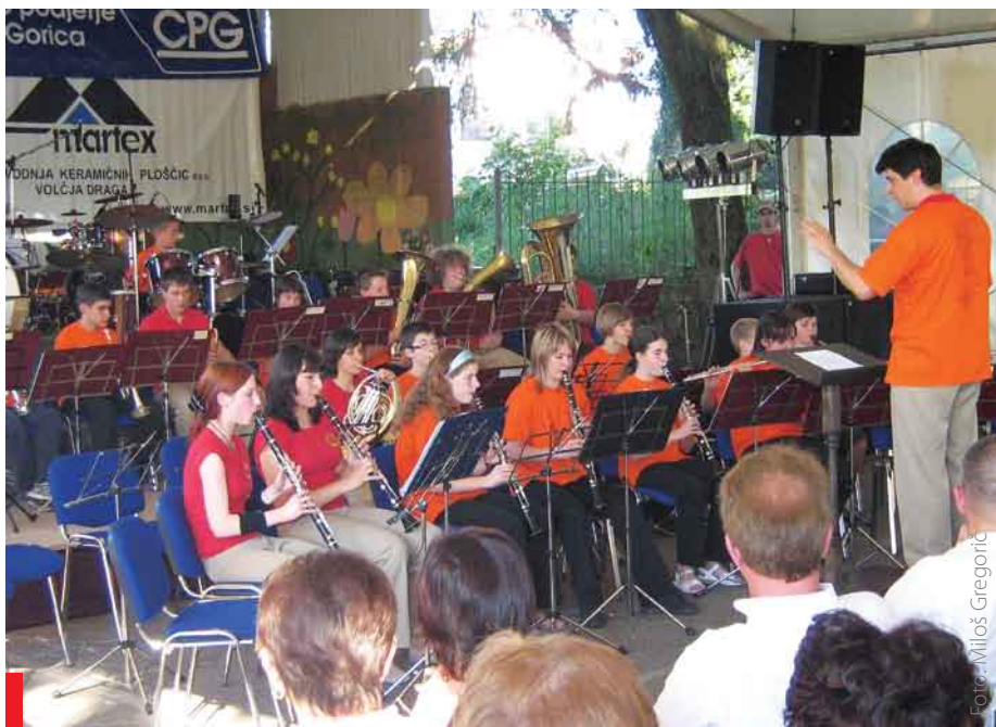
Mladinski pihalni orkester Vogrsko