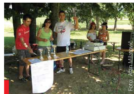
Nogometni turnir 1 in 2