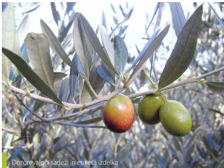
Dozorevajoči sadeži in etiketa izdelka