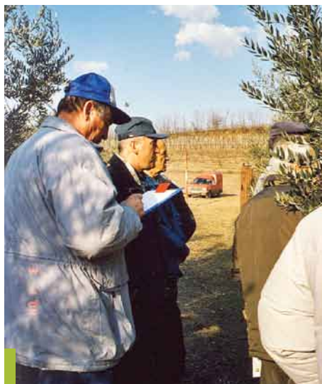
Člani društva pri pouku obrezovanja oljk

Še veliko je bilo aktivnosti, ki so bile vse sprejete z izrednim zanimanjem in navduše-