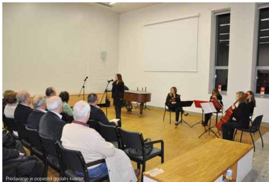
Predavanje je popestril godalni kvartet

S tem zgodbo o rimskodobnem Britofu še ni konec. Med izkopavanji so bili odkriti ostanki zelo velikega stavbnega kompleksa, ki je imel osrednje dvorišče, okoli katerega so bile razporejene stavbe. Raziskan je bil le njegov manjši del, a domneva se, da je bil v tlorisu pravokotne oz. kvadratne oblike (verjetno z eno odprto stranico) in se je raztezal na površini okoli 10 hektarjev. Med izkopavanji ni bilo odkritih drobnih najdb, ki bi omogočale natančno časovno opredelitev te arhitekture. Glede na to, da je bil pri gradnji stavbnega kompleksa uporabljen ruševinski material stavb iz časa od 1. do 3. stoletja, sklepamo, da je bil zgrajen konec 3. ali verjetneje v 4. stoletju. Zaenkrat tudi ni povsem jasno, čemu je struktura služila, prav odsotnost