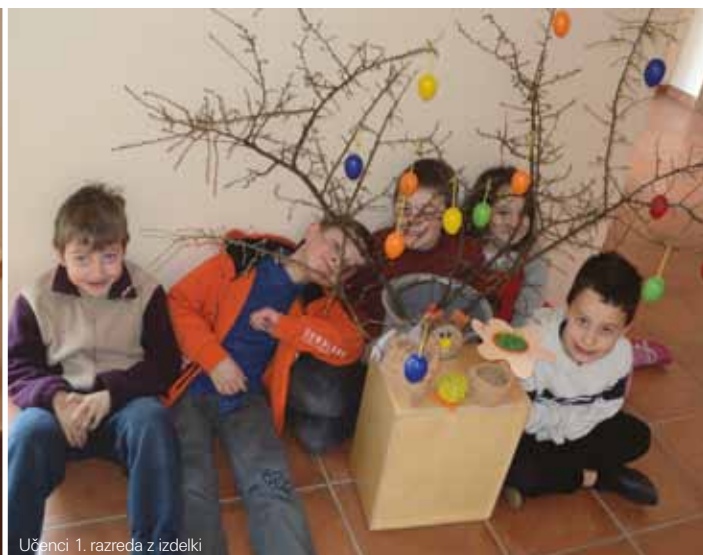
Učenci 1. razreda z izdelki