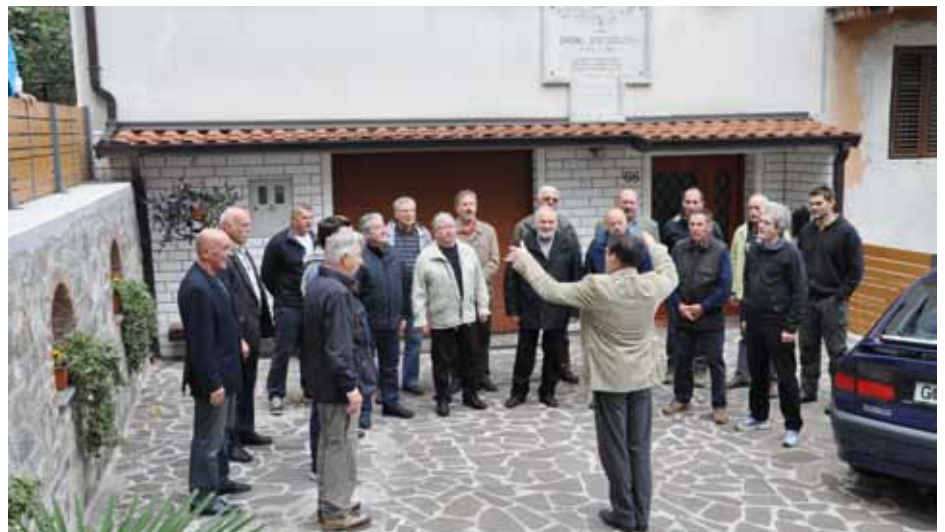
Ob spominski plošči Simona Gregorčiča je zadonela njegova pesem

V lanskem letu smo se z veseljem odzvali povabilu lokalnih društev in institucij in tako sodelovali pri dogodkih v okviru praznovanja 35. letnice pobratenja s Štarančanom, izvedbi praznika rac, prireditvi Zgod-