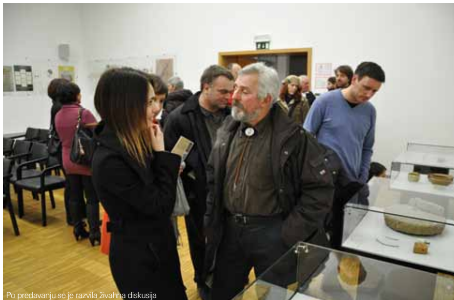
Po predavanju se je razvila živahna diskusija

najdb bi nakazovala, da je bil z izkopavanji zajet gospodarski del poslopja (npr. hlevi za živino, skedenj ipd.).