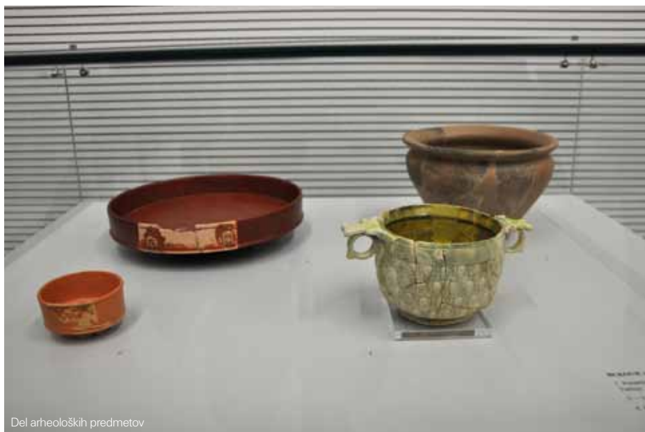
Del arheoloških predmetov