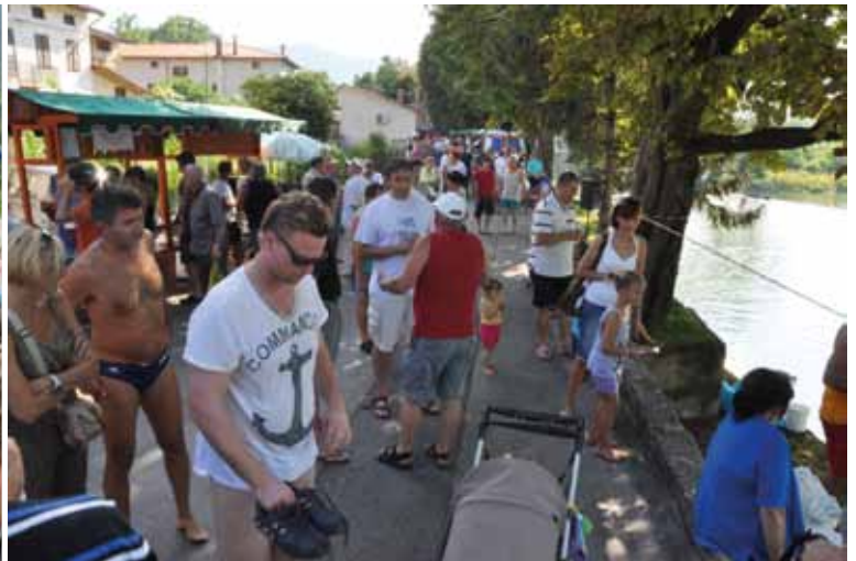
Mohorjev praznik je vedno dobro obiskan

sekcije v Hiši Fundacija poti miru v Posočju, z otvoritvijo razstave slik na temo Simona Gregorčiča. Slike so nastajale na extemporih ob Gregorčičevi poti med Renčami in Grajščem, pa tudi drugje.