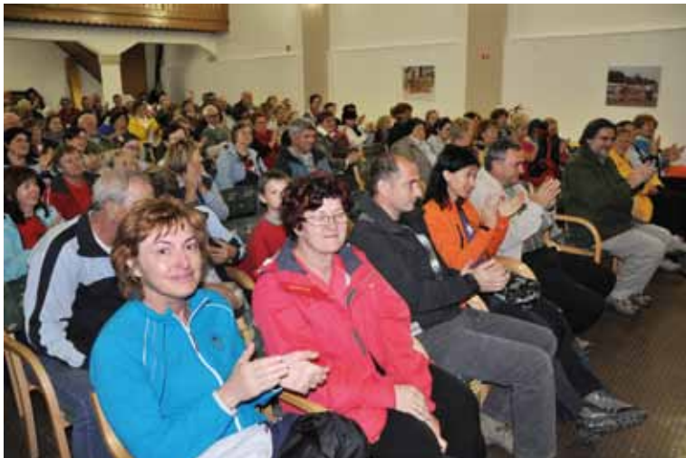
Tudi prireditve v dvorani se udeležuje veliko krajanov