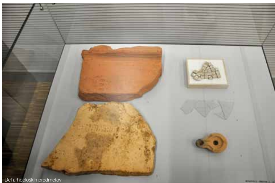
Del arheoloških predmetov

Besedilo: Ana Kruh (Goriški muzej)