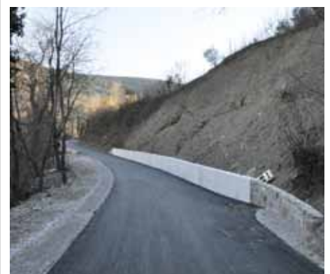
Obnovljen najbolj kritičen del ceste.

prisrčen program. Sledil je pohod na Vinišče, na katerem so nas pričakali domačini in nam pripravili dobrodošlico s kruhom in pršutom.