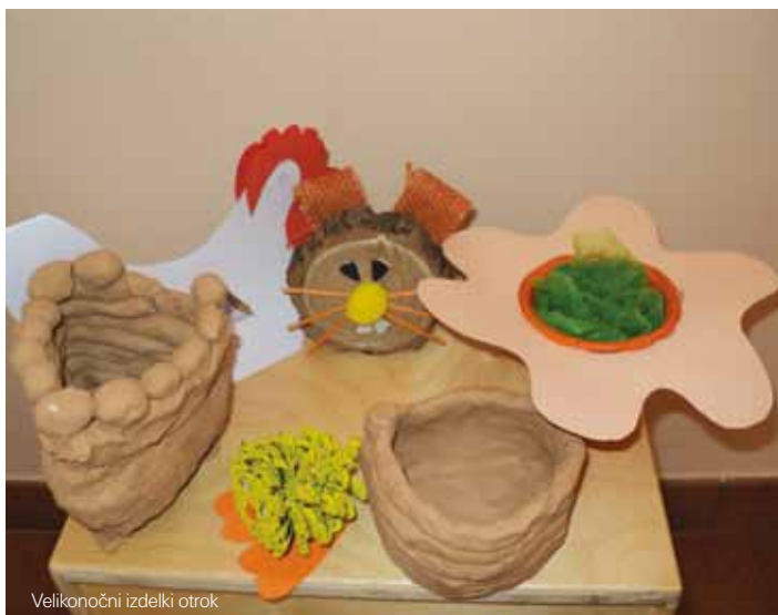
Velikonočni izdelki otrok