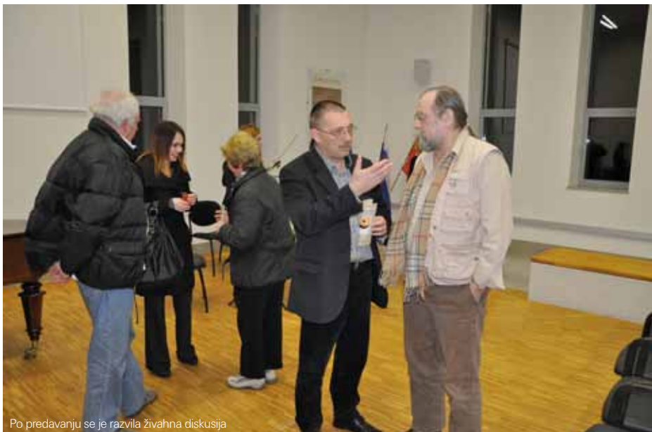
Po predavanju se je razvila živahna diskusija

7. februarja, na predvečer slovenskega kulturnega praznika, je bila v Kulturnem domu v Bukovici javnosti predstavljena arheološka razstava Rimskodobna Bukovica . Pripravo razstave, ki je nastala v sodelovanju Goriškega muzeja in Centra za preventivno arheologijo Zavoda za varstvo kulturne dediščine Slovenije, je finančno podprla Občina Renče-Vogrsko .