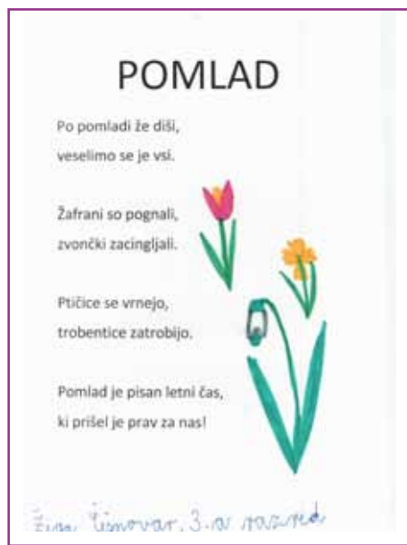
Pomlad, pesmica Žige Čišnovarja, učenca 3. razreda OŠ Renče