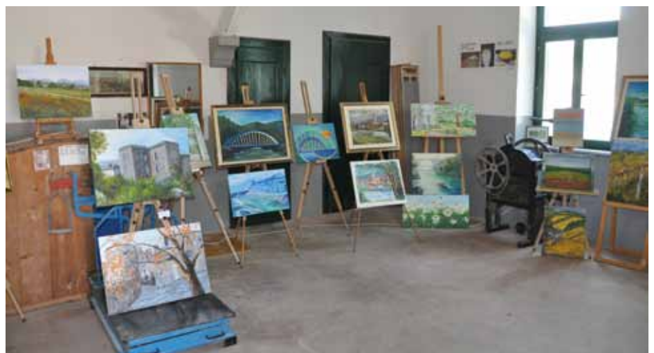
Slikarke so v mlinu postavile lepo razstavo

be iz Vipavske doline na Ljubljanskem gradu in tradicionalnem decembrskem živ-žavu.