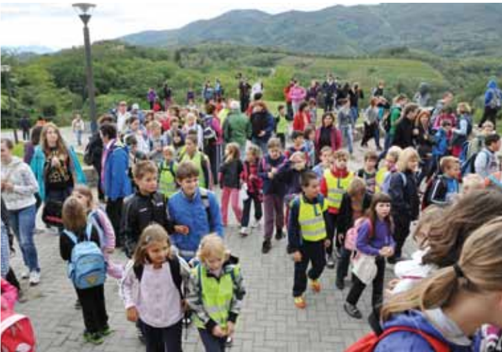
Pohvalno je, da se pohoda po Gregorčičevi poti udeležuje veliko mladih