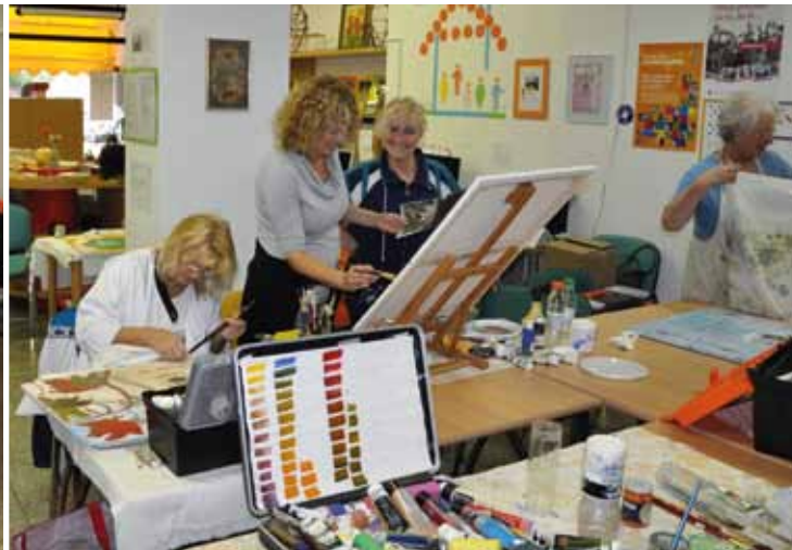
Da lahko razstavljajo, morajo slikarke kar intenzivno slikati

Začetek leta je obdobje, ko v društvih pokramljamo o delu v preteklem letu in nabiramo ideje za nadaljnje delo. In kaj smo počeli v Društvu za kulturo, turizem in razvoj Renče v lanskem letu?