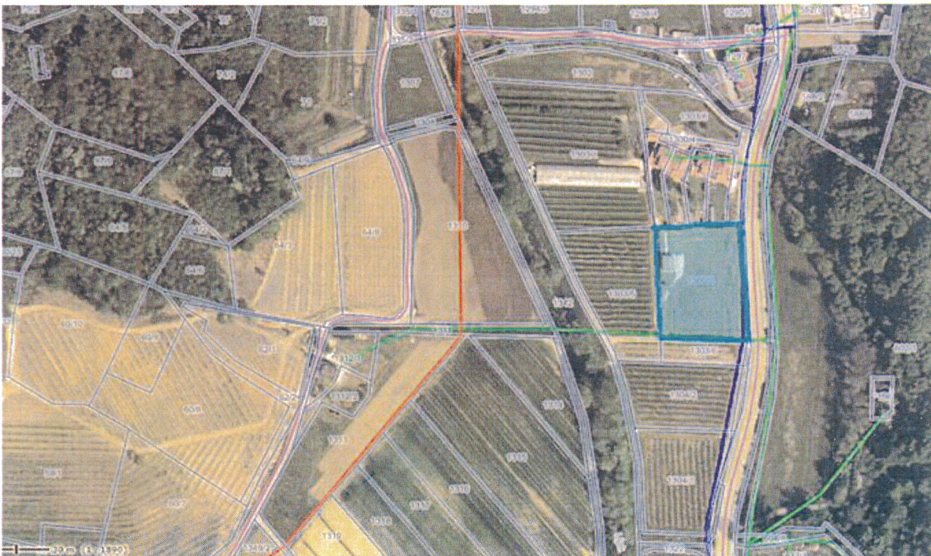
Trenutna raba (travnik in ni GERKa):