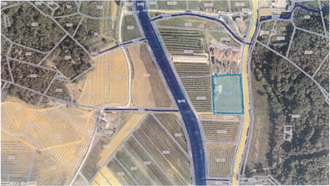
Prikaz vse obstoječe infrastrukture: