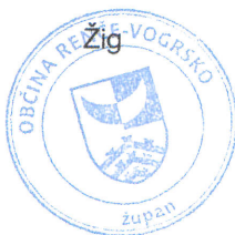
Tarik Žigon Župan