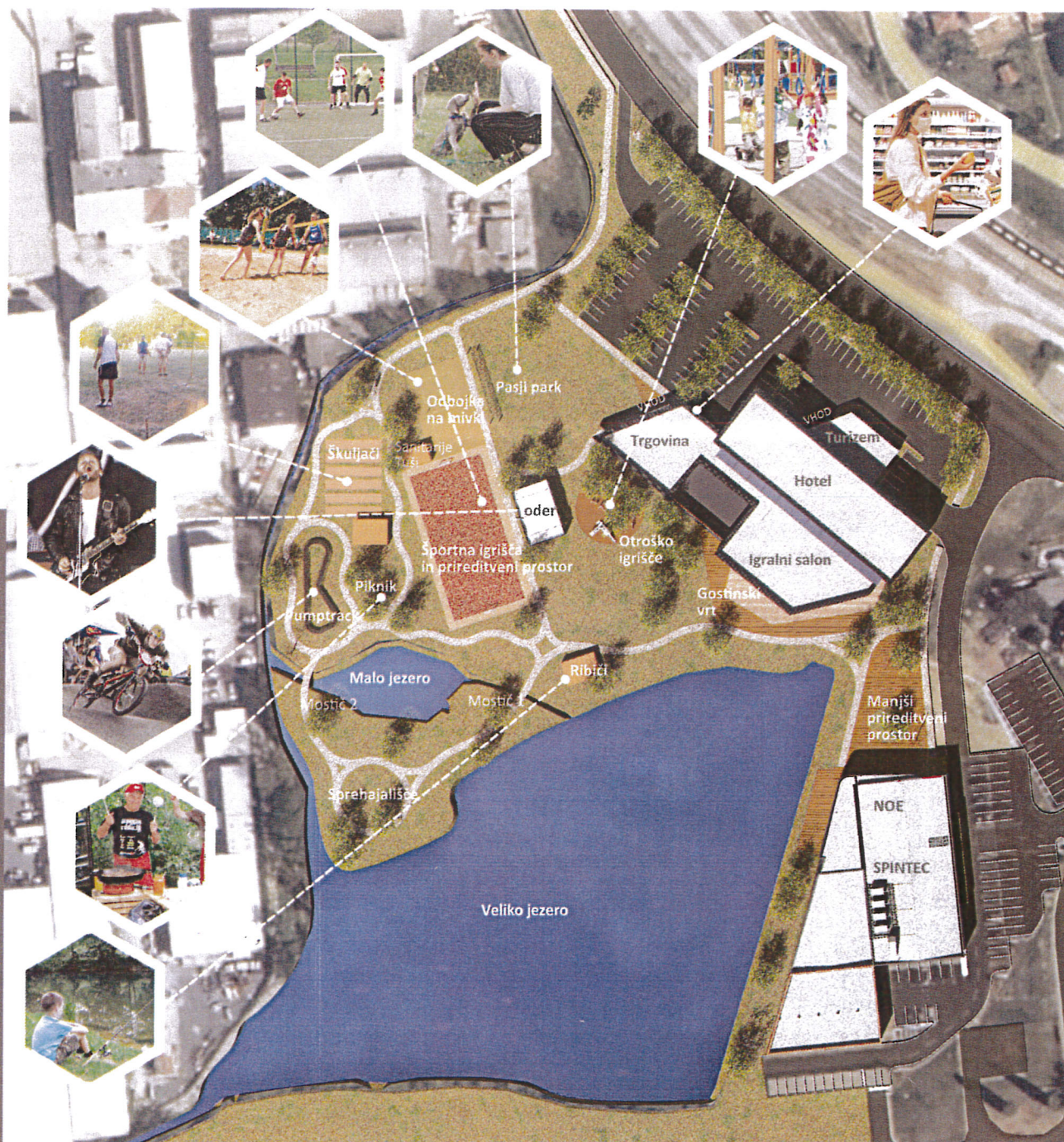
Ocena učinkov turistično-poslovnega projekta LAGO za občino: