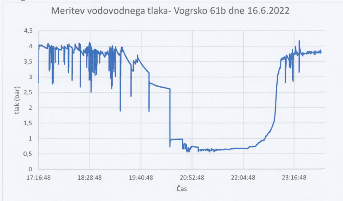
Slika 1: meritev tlaka prikazuje padec do tlaka 0,6bar. Višinska razlika do vodnih porabnikov ca. 6m in izgube do vodnih porabnikov niso upoštevane