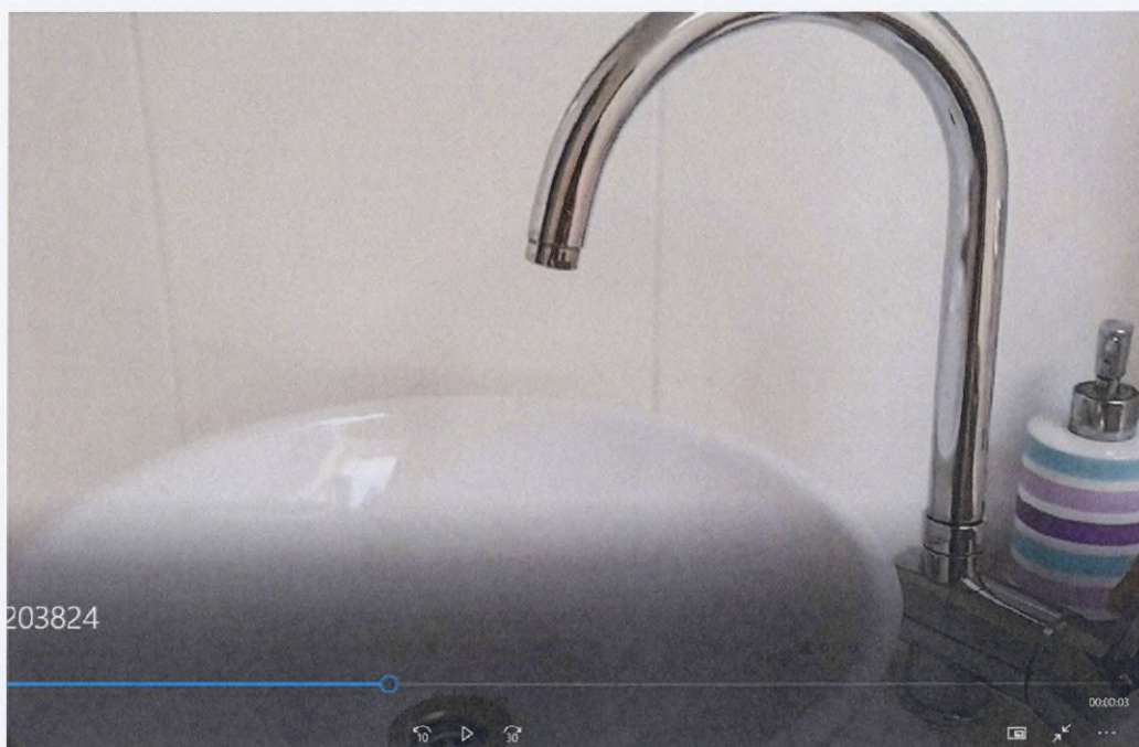
Slika 3: V primeru, da je tlak na merilnem priključku nižji od 1 bar ni dotoka vode (video prikazuje, da kljub odprtem vodovodnem ventilu ni dotoka vode_ snemano dne 16.6.2022 okoli 21 ure na lokaciji Vogrsko 61b).