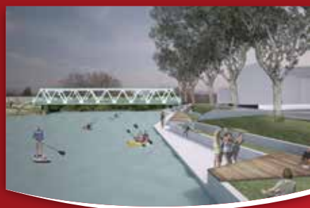
11 IZ OBČINE Revitalizacija starega vaškega jedra v Renčah