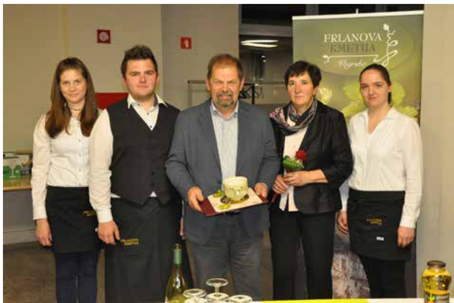
Družina s Frlanove kmetije vključno z bodočo nevesto

načrtujejo popestritev turistične ponudbe z izgradnjo sob za goste, kar bo še dodatno pripomoglo k prepoznavnosti našega kraja in občine ter jih uvršča med pomembne dejavnike pri razvoju kmetijstva, gospodarstva in turizma v Vipavski dolini.«