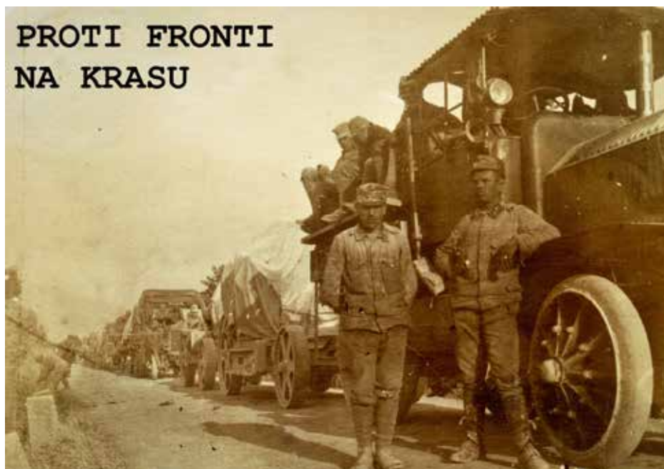
PROTI FRONTI NA KRASU

Konec prve ofenzive ni pomenil, da so se spopadi zaustavili, kvečjemu se je zmanjšala njihova moč. Grof Cardorna in njegov štab seveda niso bili zadovoljni z rezultati prve ofenzive in so začeli s pripravami na drugo ofenzivo.