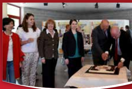
14 IZ KRAJEVNIH SKUPNOSTI Štirideset let pobratenja med Renčami in Štarancanom