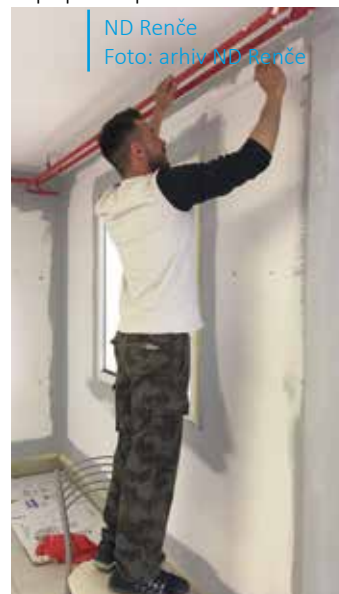
ND Renče