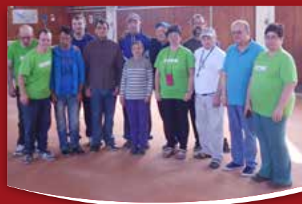
39 OBČINA PO MERI INVALIDOV VDC Nova Gorica praznuje 40 let