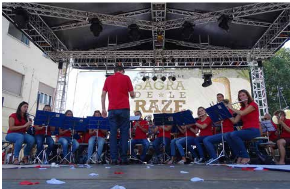
Nastop v Štarancanu

Že naslednji petek, 1. septembra, je orkester sodeloval pri kulturnem programu krajevnega praznika Vogrsko – pravzaprav je letošnji praznik skupaj z otroki osnovne šole na Vogrskem kar otvoril. Za začetek so namreč skupaj odigrali in zapeli venček skladb iz slovenskih mladinskih filmov, orkester pa je obiskovalce praznika razveselil še z drugimi skladbami. V petek, 29. septembra, je orkester so-