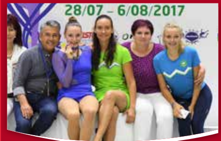
28 ŠPORT Dve medalji na evropskem prvenstvu