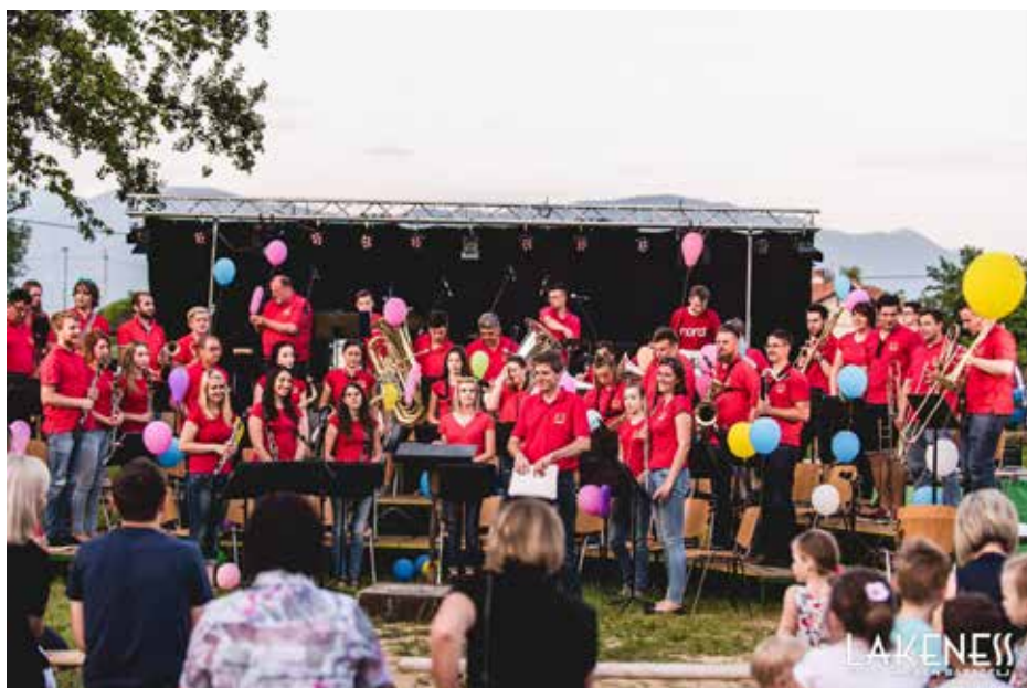
Letošnji slavljenec Pihalni orkester Vogrsko