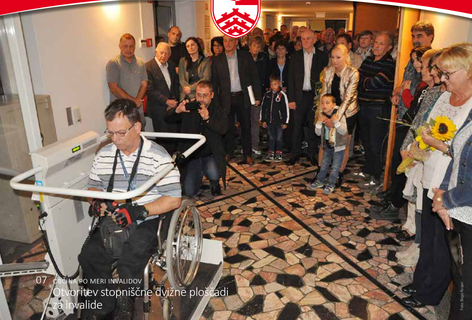
07 OBČINA PO MERI INVALIDOV Otvoritev stopniščne dvizžne ploščadi za invalide