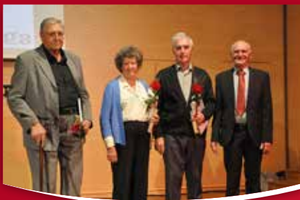
10 IZ KRAJEVNIH SKUPNOSTI Bukovica in Volčja Draga praznujeta