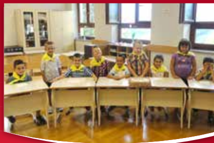
23 ŠOLA Drugačen prvi september na POŠ Vogrsko