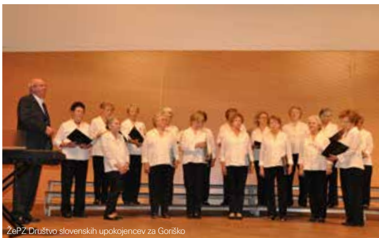
ŽePZ Društvo slovenskih upokojencev za Goriško