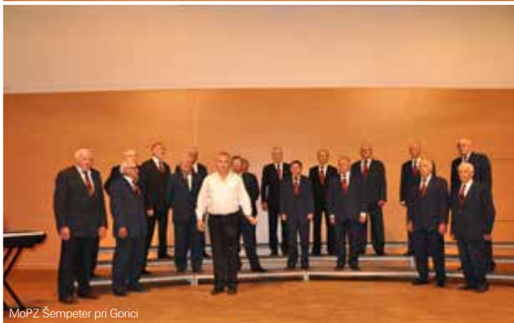
MoPZ Šempeter pri Gorici