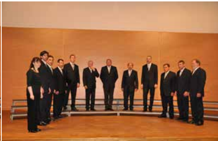
Moški pevski zbor Lijak 1883 Vogrsko