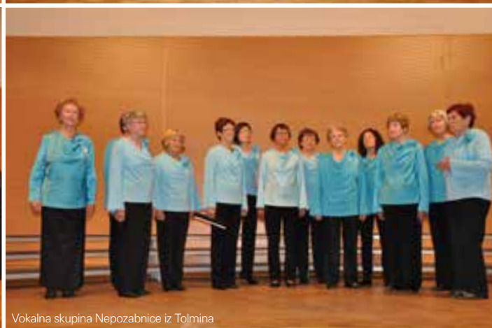
Vokalna skupina Nepozabnice iz Tolmina