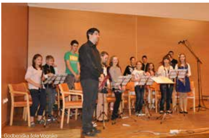
Godbeniška šola Vogrsko