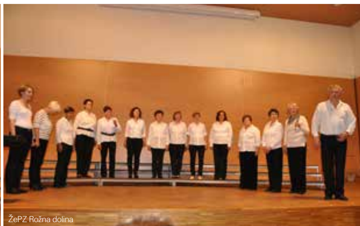
ŽePZ Rožna dolina