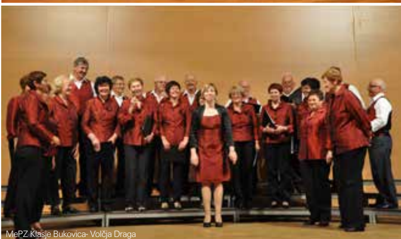
MePZ Klasje Bukovica- Volčja Draga