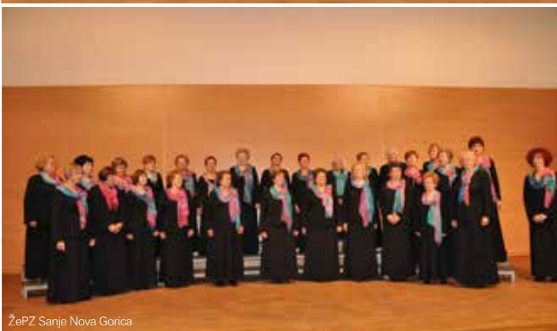
ŽePZ Sanje Nova Gorica