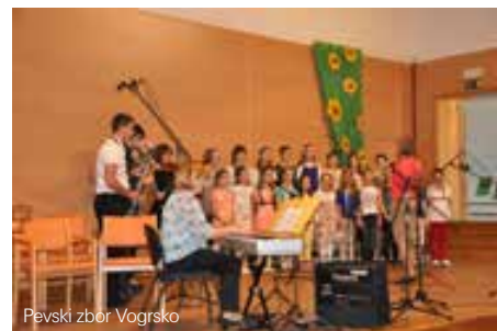
Pevski zbor Vogrsko