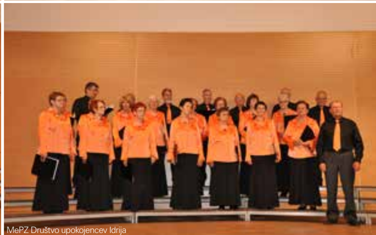
MePZ Društvo upokojencev Idrija

V veliki dvorani Kulturnega doma v Bukovici je ponovno odmevalo zborovsko petje. Na reviji upokojenjskih pevskih zborov severne Primorske se je letos predstavilo 11 zborov s skoraj 250 pevci.