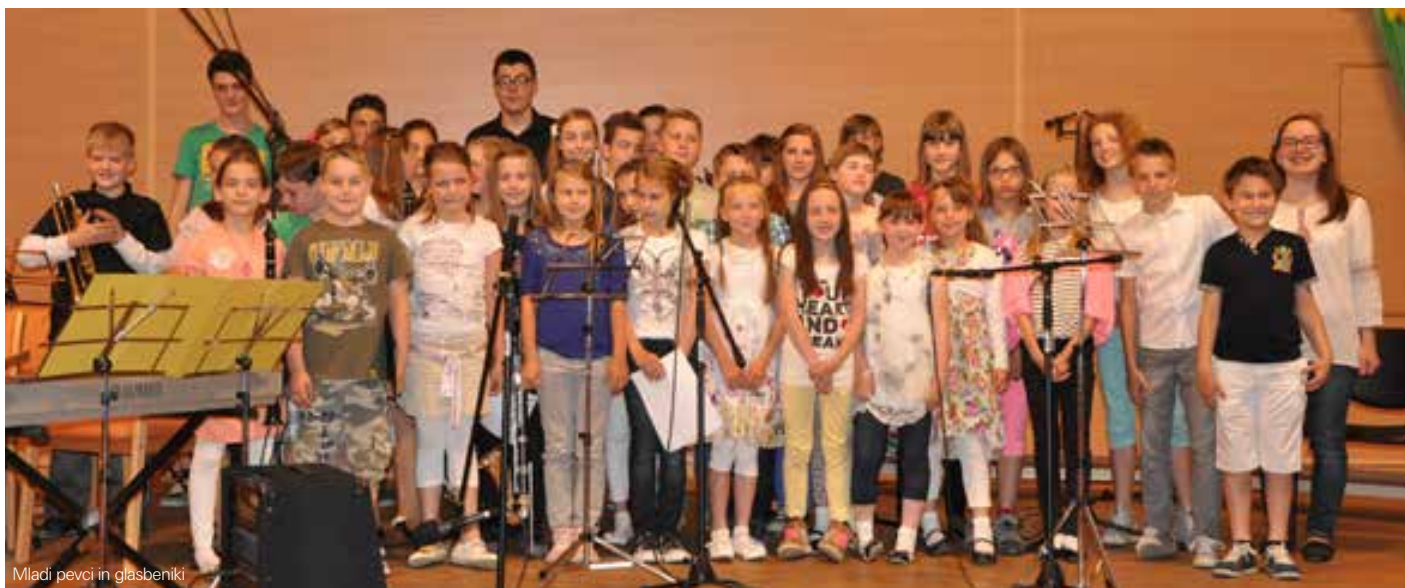
Mladi pevci in glasbeniki

Leto je naokoli in mladi glasbeniki so se spet skrbno pripravili na tradicionalen pomladni nastop. V veliki dvorani Kulturnega doma v Bukovici so se predstavili na četrtem srečanju mladih glasbenikov naše občine.