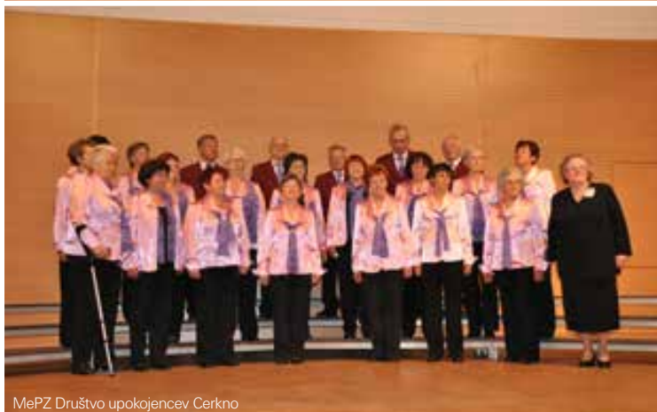
MePZ Društvo upokojencev Cerkno