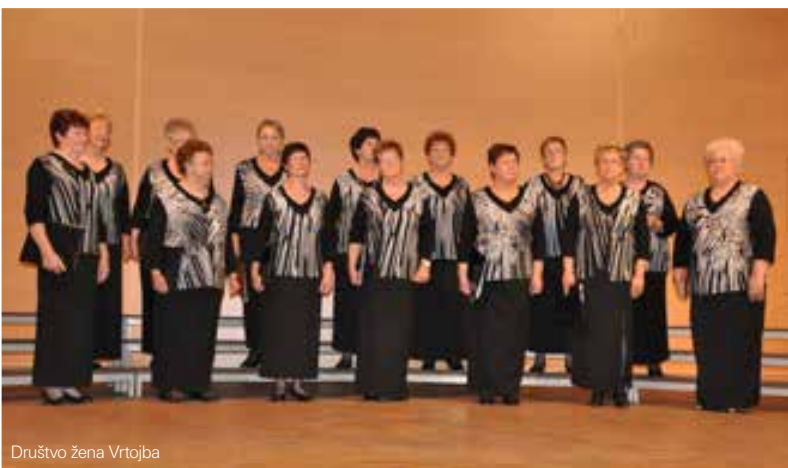
Društvo žena Vrtojba