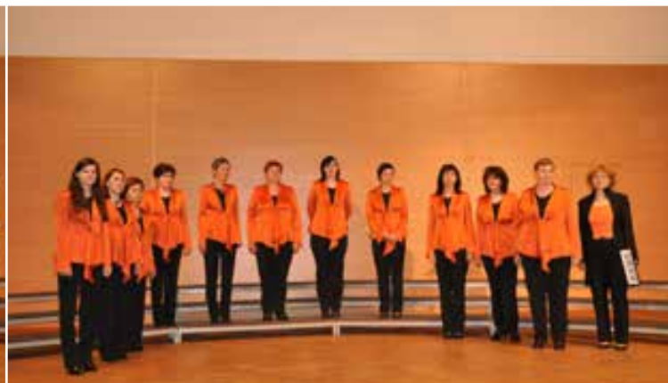
Pevski zbor OŠ Lucijana Bratkoviča Bratuša Renče