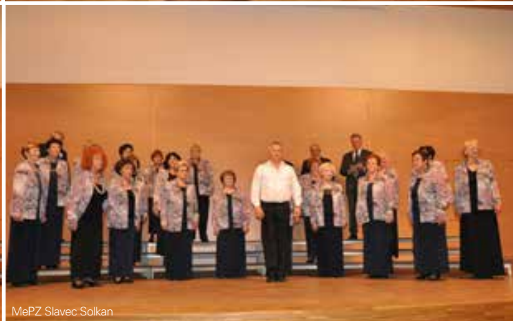
MePZ Slavec Solkan