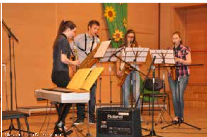
Glasbena šola Nova Gorica