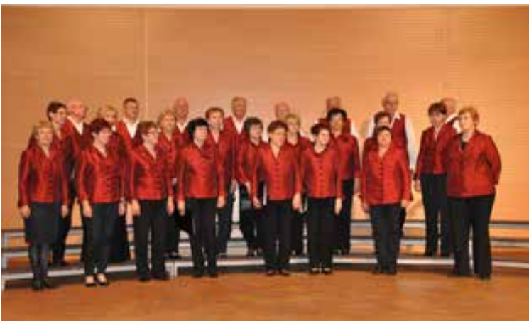
MePZ Klasje - Bukovica-Volčja Draga

Sledil je prenos slavnostne predaje Prenosne plakete Revije pevskih zborov ob prazniku Občine Renče-Vogrsko; organizator letošnje revije - predsednik MoPZ Lijak 1883 Vogr-