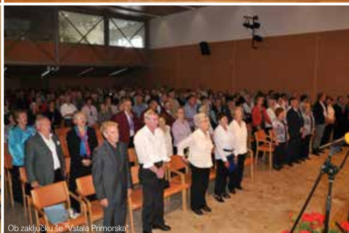
Ob zaključku še "Vstala Primorska"