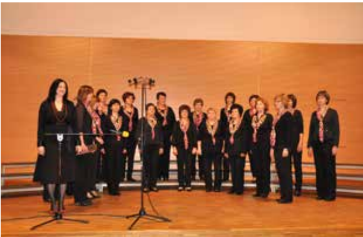
Ženski pevski zbor »Vogrinke«