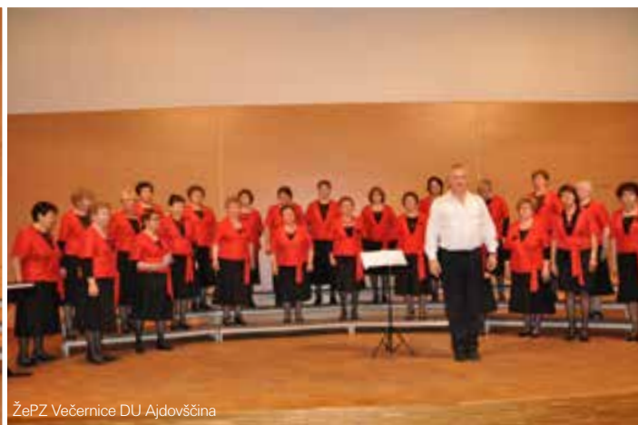
ŽePZ Večernice DU Ajdovščina